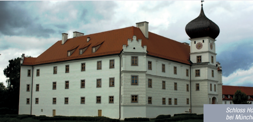
Schloss Hohenkammer bei München