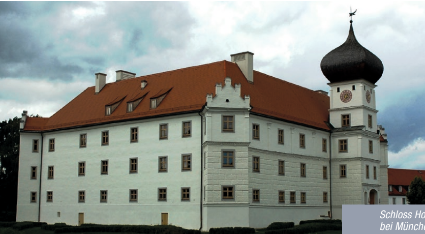
Schloss Hohenkammer bei München