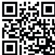
QR-Code zur Onlineanmeldung