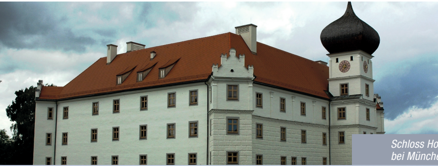
Schloss Hohenkammer bei München