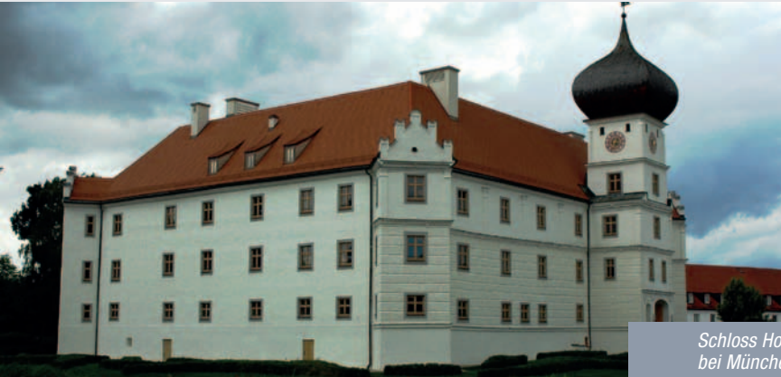
Schloss Hohenkammer bei München